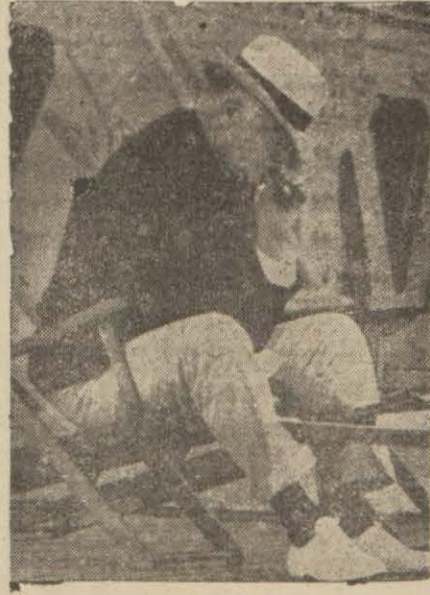
Amerika Cümhur Reisi M. Hoover

Berlin, 21 (A.A.) — Alman hükümeti, M. Hoovere teklifini kabul etmekte olduğunu bildirmiştir.