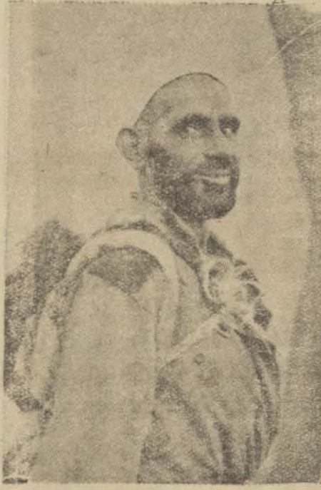
İranda yolda ras geldiğimiz Yayan yolculardan biri

Baktım, yol sağa doğru gidiyordu, biz de bu izi takibe başladık.