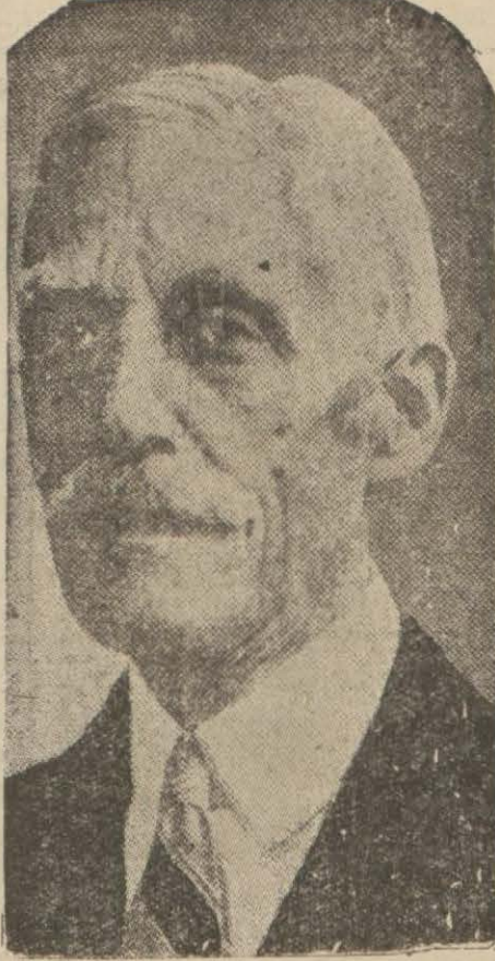
Avrupaya gelen Amerika Maliye Nazırı M. Mellon

Çünkü, nihayet... Bütün arzularımı tatmin etmek.. Ben de bunu isterdim, mes'ut bir kadın olmadığımı hissediyordum. Bir